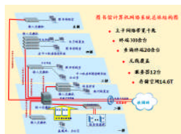
图书馆网络拓扑图